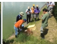
ため池の外來種駆除

実施主体：農業者等で構成される組織（①及び③は農業者のみで構成する組織でも取組可能） 対象農用地：農振農用地及び多面的機能の発揮の観点から都道府県知事が定める農用地