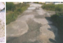
農道の窪みの補修