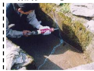
水路のひび割れ補修