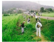
農地法面の草刈り