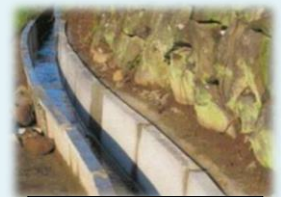
素堀り水路からの更新