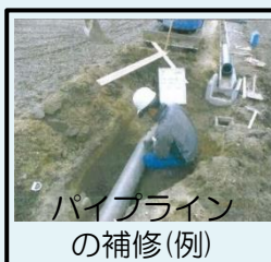
パイプラインの補修(例)