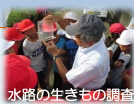
水路の生きもの調査