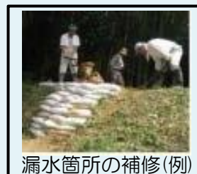
漏水箇所の補修(例)