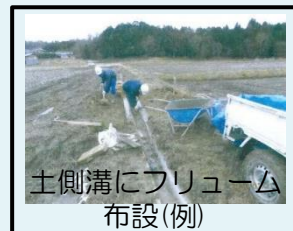
土側溝にフリューム布設(例)