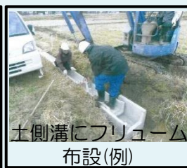
土側溝にフリューム布設(例)