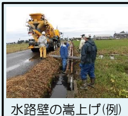
水路壁の嵩上げ(例)