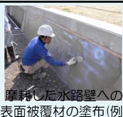
摩耗した水路壁への表面被覆材の塗布(例)