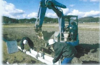
ヘルメット装着状況