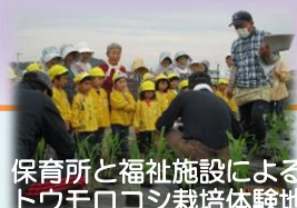
保育所と福祉施設によるトウモロコシ栽培体験地