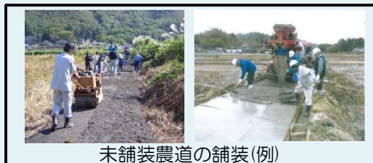
未舗装農道の舗装(例)