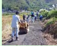
未舗装農道の舗装