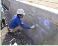
摩耗した水路壁への表面被覆材の塗布