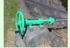
ゲート、バルブの更新

※令和元年度から、交付金の効率的かつ効果的な執行の観点から、原則として「工事1件当たりの費用は200万円未満」とします。