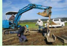
コンクリート水路の更新